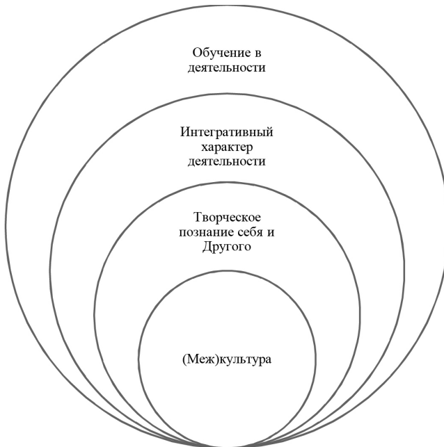
Рис. 3. Кластер «Содержательно-смысловое наполнение» ценностного ядра ФНИиГ