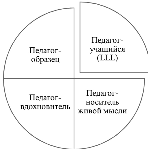
Рис. 2. Кластер «Портрет педагога» ценностного ядра ФНИиГ