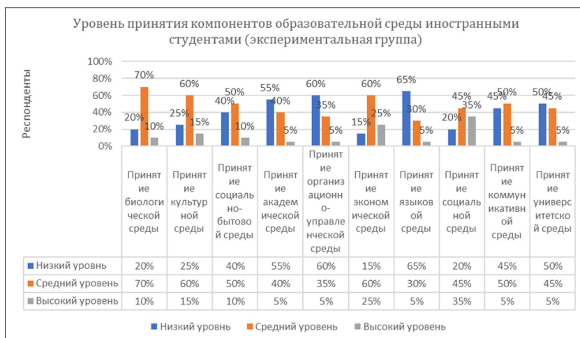
Рис. 1. Уровень принятия университетской среды иностранными студентами (экспериментальная группа)

цифровое чтение представляет собой комплексную педагогическую практику с применением цифровых технологий и инструментов, воздействующую на личность иностранного студента через информирование об адаптивной ситуации, анализ полученной информации и рефлексивную деятельность с целью формирования качеств, адекватных окружающей среде.