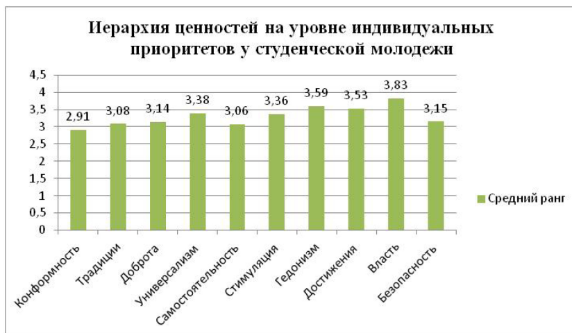
Рис. 2. Иерархия ценностей на уровне индивидуальных приоритетов у студенческой молодежи по методике «Ценностный опросник Ш. Шварца» (средний показатели)

Ниже представлена иерархия ценностей на уровне индивидуальных приоритетов у студенческой молодежи (см. рис. 2).