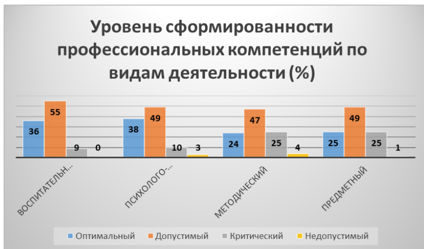
Рис. 2. Уровни сформированности профессиональных компетенций педагогов физической культуры в области воспитательной, психолого-педагогической, методической и предметной деятельности

Результаты диагностики сформированности профессиональных умений учителей физической культуры в области предметной, психолого-педагогической и методической подготовки представлены на рисунке 2.