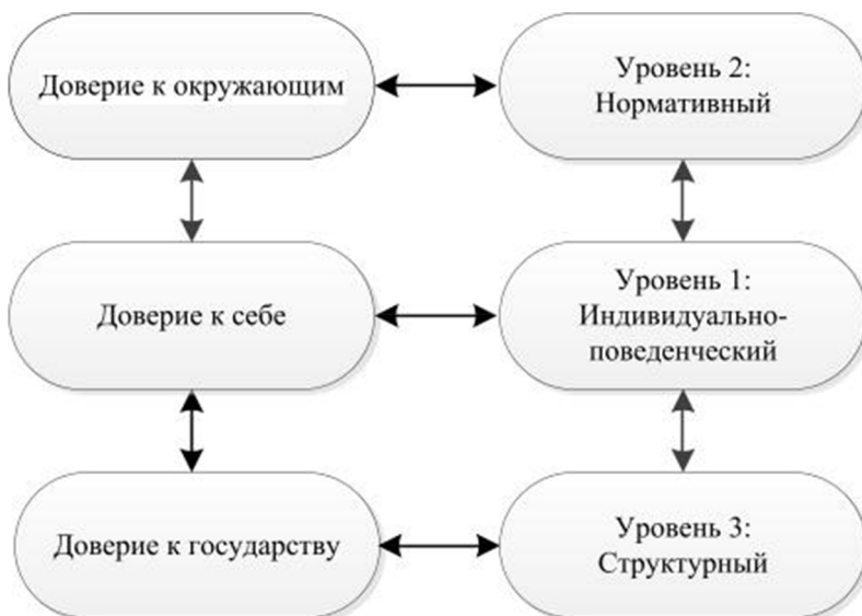
Рис. 1. Модель взаимосвязи доверия и поведения в кризисной ситуации.

образом, можно рассматривать взаимосвязь доверия и поведения следующим образом (Рис. 1):